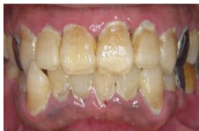
プラーク（歯垢）がついているお口の中

がん治療開始前 にお口の中をきれいにしておくこと がん治療時におこるトラブルを予防できることを 知っていますか？