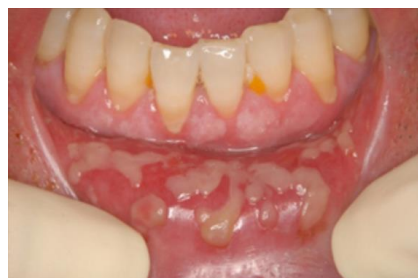
口内炎ができています患者さんのお口の中

治療中は口内炎やカンジタ症（カビの一種）など口の中のトラブルがおこりやすくなりますが、その発生を減らすことができます。