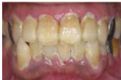
プラーク（歯垢）がついているお口の中

がん治療開始前 にお口の中をきれいにしておくこと がん治療時におこるトラブルを予防できることを 知っていますか？