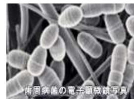
歯周病菌の電子顕微鏡写真

大人の口の中には歯ブラシを十分している人で約 2000 億個、十分でない人は 4000 億～6000 億個もの細菌がいます。