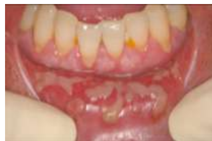
口内炎ができています患者さんのお口の中

治療中は口内炎やカンジタ症（カビの一種）など口の中のトラブルがおこりやすくなりますが、その発生を減らすことができます。