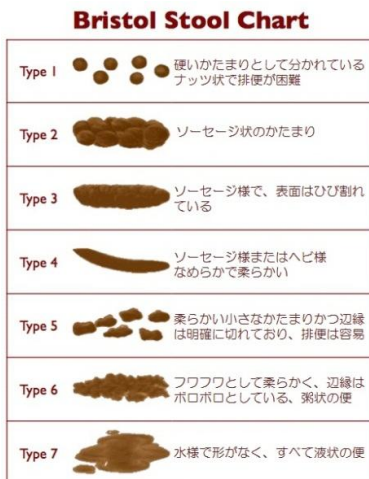
図 1) ブリストル便チャート

こどもが便秘症で困っている、少し話を聞いてみたいなというときは、お気軽にご相談ください。