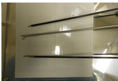
鉗子とテレビモニター

患者の体に“やさしい手術を”を合言葉に情熱をもって診療にあたっておりますのでご相談いただければと思います。