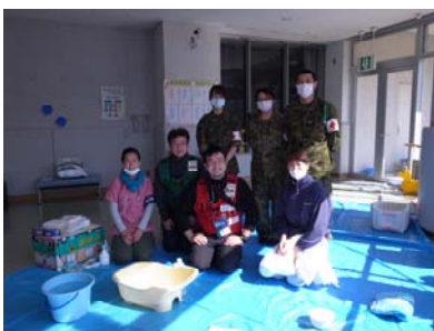
多摩南・自衛隊による沐浴チーム