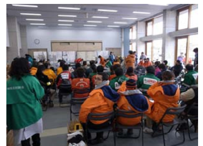
本部でのミーティング風景