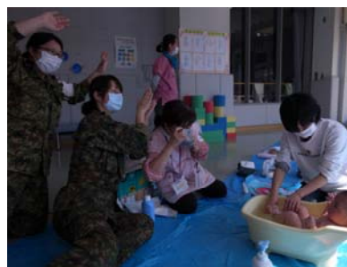
沐浴風景「気持ちいいね」